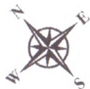
Схема размещения контейнеров для сбора ТКО по ул. Ангарской, ул. Красноярской, ул. Дёповской, ул. 2 Дёповской