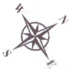
Схема размещения контейнеров для сбора ТКО по ул. Дарвина, ул. Бажова