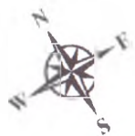
Схема размещения контейнеров для сбора ТКО по ул. Северной, ул. Амурской, ул. Читинской